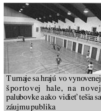
Turnaje sa hrajú vo vynovenej športovej hale, na novej palubovke a ako vidieť tešia sa záujmu publika

Ďalší turnaj sa uskutoční v nedeľu 5. januára 2003